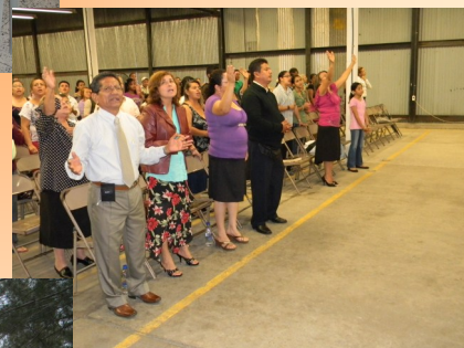
Participando de la Reunión General en A.V. El Progreso